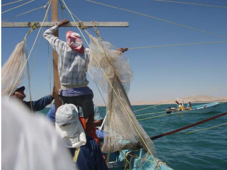
Preparando la maniobra de pesca