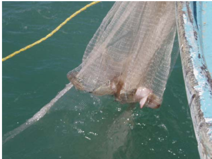
Cobrado y captura de un lance de pesca con red suripera