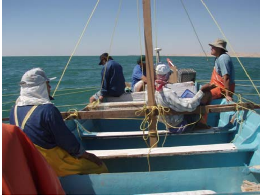
Esperando el momento de levantar la red suripera