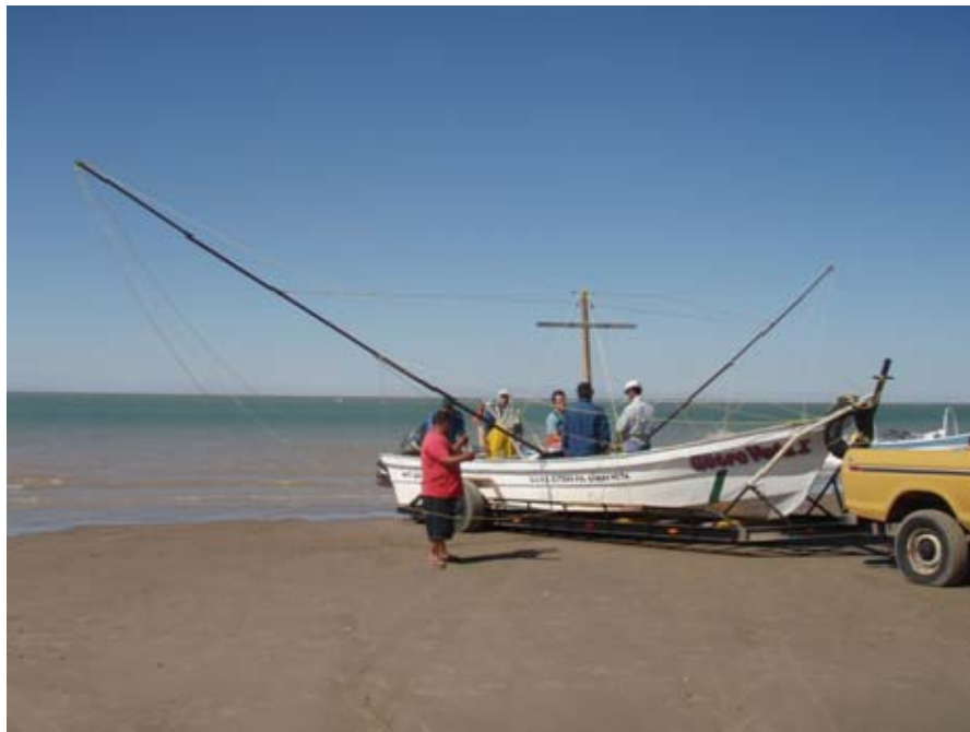
Vista general del aparejamiento de la embarcación