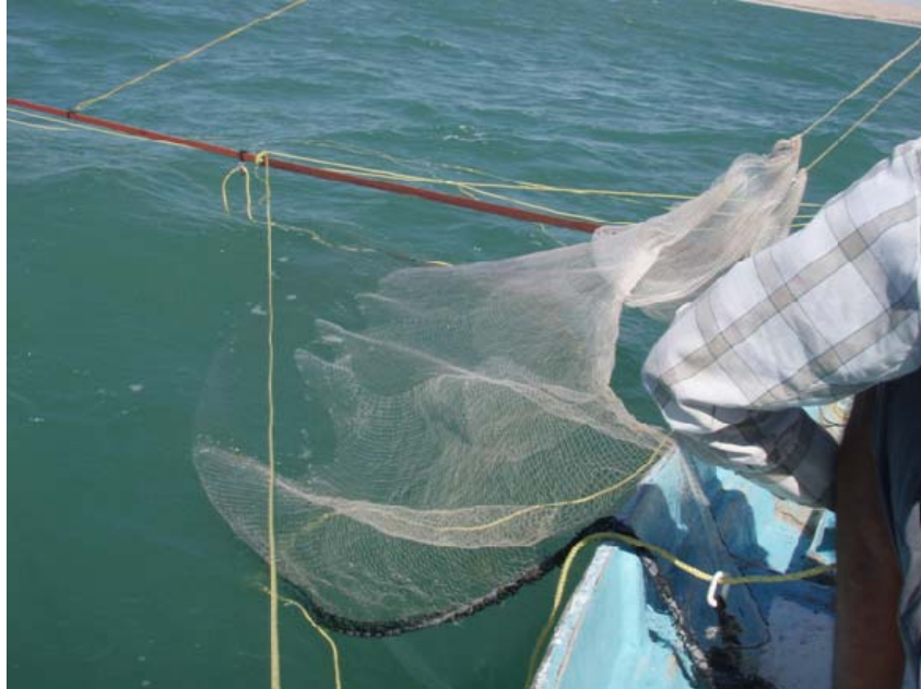
Falda y relinga de lastre de la red suripera e inicio del arrastre