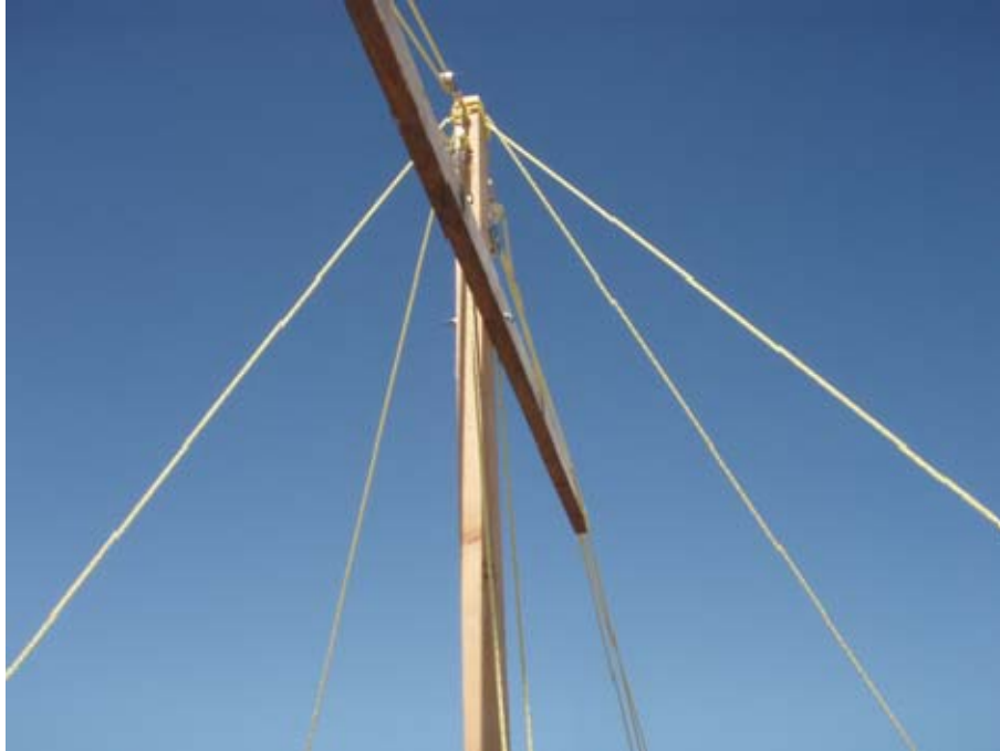
Vista general del mástil