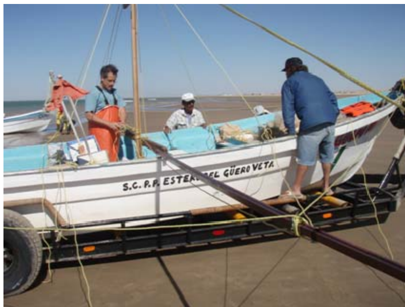
Preparando la salida a realizar actividades de pesca experimental